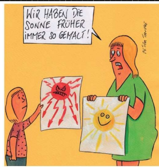
15. Juni 2022